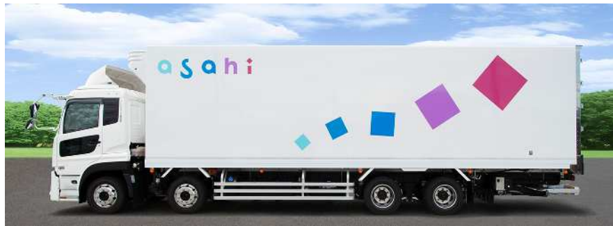
“オリガミ”カラーに想いをこめて

当社の物流は1945年(昭和20年)、原乳輸送から始まりました。徹底した温度管理、24時間365日止まることのない物流のノウハウは、現在まで受け継がれています。人が生きるために必要不可欠である「食」を支える物流インフラ企業として、私たちは食を通じて日本中の家族を「豊か」にするために走り続けます。