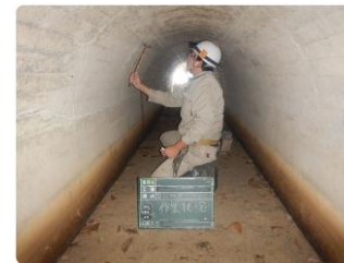
開水路を始めとする水路トンネルや暗渠などの水路構造物、ダムの機能診断を行うほか、その後の維持管理についての保全計画策定も対応します。