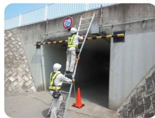
カルバートは小型のものから大型BOX、溝橋の点検も対応します。