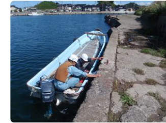
陸上からの確認が困難な岸壁や防波堤は船上確認や潜水目視で対応するほか、水中コアや板厚調査などの微破壊調査も行います。