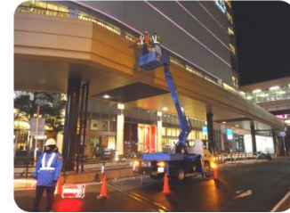
規制図作成や協議資料の作成から対応し、場所によっては高所作業車を用いて点検します。