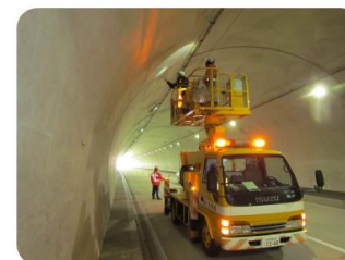
数多く対応しているトンネル点検では、交通規制の準備から作業車の手配まで対応します。