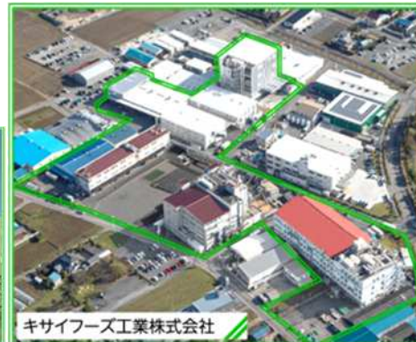
キサIFOODS工業株式会社