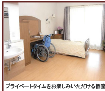
プライベートタイムをお楽しみいただける個室

採用人数、選考方法、賃金、就業時間、休日等詳細については面接会時配布の資料をご確認願います。