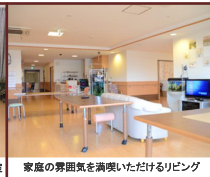
家庭の雰囲気を感じいただけるリビング