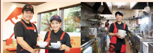
働きやすい環境で長く働ける「山田うどん」