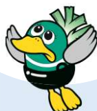
越谷特別市民 「ガーヤちゃん」