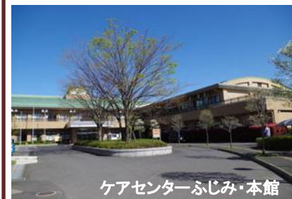
ケアセンターふじみ・本館

富士見市社会福祉事業団は、特別養護老人ホームふじみ苑を中心としたケアセンターふじみの運営及び市立放課後児童クラブを指定管理者として運営しています。 ケアセンターふじみは、富士見市のほぼ中央に位置し、前面には「江川」が流れ、鯉やカルガモが遊ぶ市民のウォーキングコースとなっています。