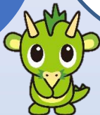
さいたま市 PRキャラクター 「つなが電メウ」

浦和コミュニティ センター 多目的ホール コムナーレ10階 さいたま市浦和区 東高砂11-1