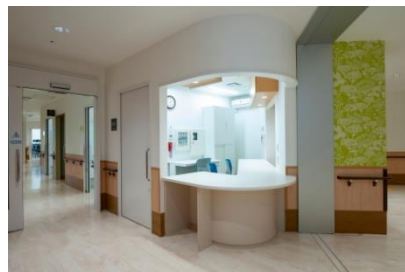
ユニット型の施設内部(令和2年3月増床)

<アクセス> 東武東上線「朝霞駅」 東口より発着の国際 興業バスにて「内間木」 バス停下車