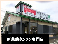
新業態タンメン専門店