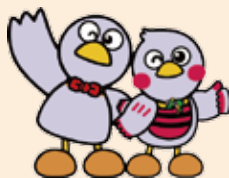
埼玉県のマスコット コバトン&さいたまっちゃん