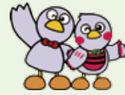
埼玉県のマスコット コバトン&さいたまっち