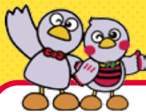
埼玉県のマスコット コバトン&さいたまっちょ