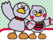
埼玉県のマスコット コバトン&さいたまっちゃん