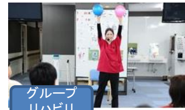
グループ リハビリ