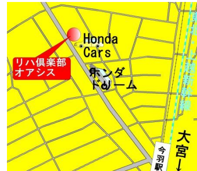
大宮 今羽駅 ニューシャトル線 今羽町下車 徒歩3分