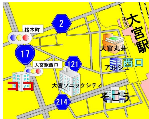
JR大宮駅西口徒歩5分