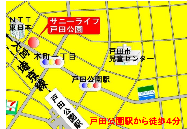
戸田公園駅から徒歩4分