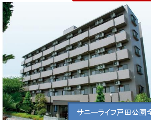
サニーライフ戸田公園全景