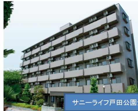
サニーライフ戸田公園全景