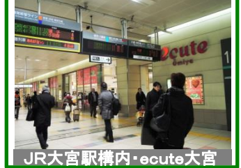
JR大宮駅構内・ecute大宮