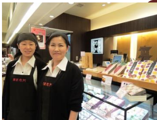
菓匠 右門 ecute大宮店

女性ばかりの店舗で、 みんなで楽しく仕事をしています。 駅構内にお店があるので、 通勤が楽です。