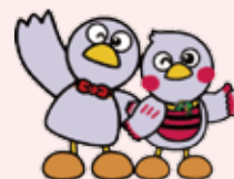
埼玉県のマスコット コバトンとさいたまっちゃん

経験豊富な講師が、これまでの業務経験等を交えながら 仕事やキャリアについてお伝えします。 参加者からの質問タイムもあります。