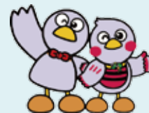
埼玉県のマスコット コバトンとさいたまっち