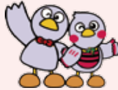
埼玉県のマスコット コバトン&さいたまっち