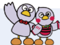
埼玉県のマスコット コバトンとさいたまっち

就活を始めたばかりの方、業界や職種を絞っておらず幅広く情報収集したい方にもおすすめのセミナーです。実際にその業界で働いている方から、リアルな話が聞ける貴重な機会です。