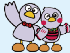
埼玉県のマスコット コバトン&さいたまっち