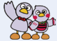
埼玉県のマスコット コバトンとさいたまっち

働き始めてから「こんなはずではなかった…」とならないように、 事例などを踏まえて、労働関係の法律の基本を学び、要点を押さえるセミナーです。