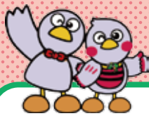
埼玉県のマスコット コバトンとさいたまっちょ