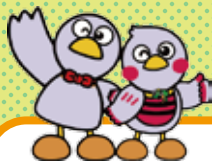
埼玉県のマスコット コバトンとさいたまっちょ