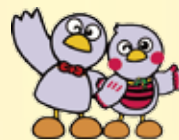
埼玉県のマスコット コバトン&さいたまっちゃん