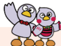
埼玉県のマスコット コバトンとさいたまっち

後回しにしがちな筆記試験対策。実は、想像以上の影響があり、 対策すれば面接へ進む企業は圧倒的に増えます。 この機会に就職活動の行き詰まりを防ぎましょう。講座では、 SPI3の頻出単元を中心にわかりやすく解説します。