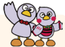
埼玉県のマスコット コバトンとさいたまっち

経験豊富な講師が、これまでの業務経験等を交えながら仕事やキャリアについてお伝えします。 参加者からの質問タイムもあります。