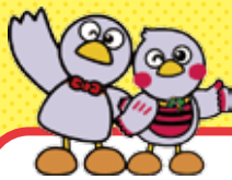
埼玉県のマスコット コバトンとさいたまっちょ