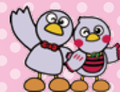
埼玉県のマスコット コバトン&さいたまっちょ