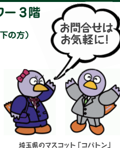
埼玉県のマスコット「コバトン」

【受付時間】月～金曜日 / 10:00～19:00 土曜日 / 10:00～17:00 ※日曜祝日、年末年始 (12/29～1/3) は除く