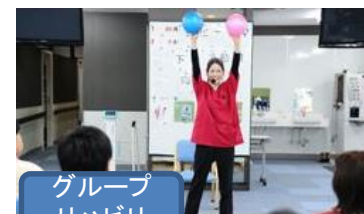
グループ リハビリ