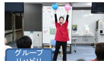
グループ リハビリ