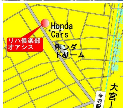
大宮 今羽駅 ニューシャトル線 今羽町下車 徒歩3分