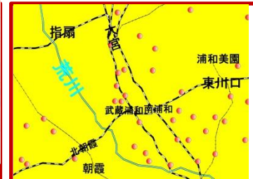
さいたま市近隣店舗一覧