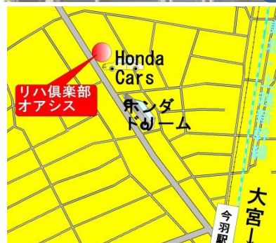
ニューシャトル線 今羽町下車 徒歩3分