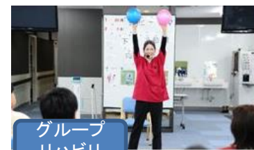
グループ リハビリ