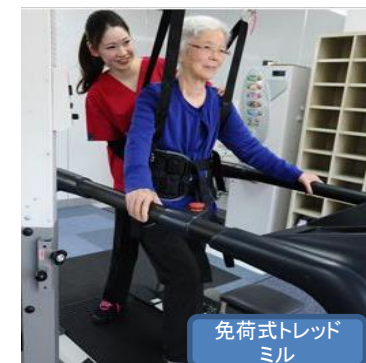
免荷式トレッド ミル